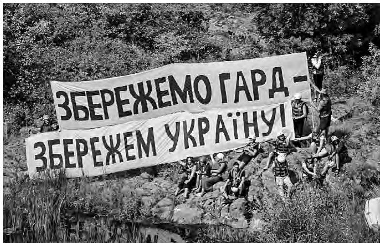
Так захищають національне надбання.

Його обурення цілком зрозуміле. Адже, на жаль, військові дії тривають. А дільні від енергетики роблять, як «вчили» з радянських часів.